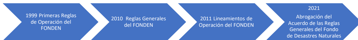
Figura 1. Formalización de reglas y lineamientos del FONDEN

El FONDEN es un instrumento financiero dentro del Sistema Nacional de Protección Civil que, operaba bajo las Reglas de Operación del propio Fondo y de los procedimientos derivados de las mismas con el fin de atender los efectos de los Desastres Naturales, imprevisibles, cuya magnitud supere la capacidad financiera de respuesta de las entidades federativas de la República Mexicana, así como a las dependencias y entidades de la Administración Pública Federal.